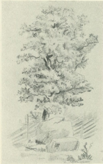
Fig. 4. Gammal ek. Ur en av Bernhard Salins skissböcker.

ljuset, som med rätta tillkom den. Detta var en gärning, som krävde ej allenast genom vidsträckta studier samlad, grundlig kunskap och uppövad museal intuition utan ock ett livs hela kraft och uthållighet. Nordiska museet, i sin egenart redan förut ett föredöme för andra folk, intog genom Bernhard Salins vidsynta ingripande en ledarställning vid de forskarvärv, som satt kännedomen om ej blott det egna folkets utan om alla folks och hela mänsklighetens kulturella utveckling såsom sitt gemensamma stora slutmål.»