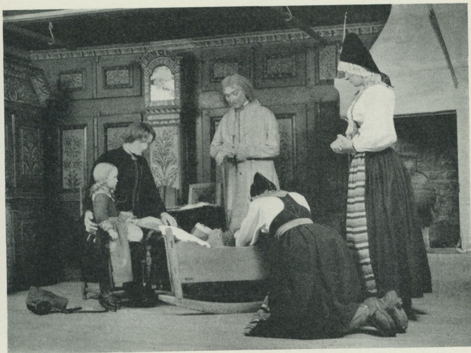
"Lillans sista bädd", Hazelius' mest berömda panorama, rekonstruerat i Nordiska museets hall 1951.

formulering av ingressen till nämndprotokollet dagen efter Hazelius' död: