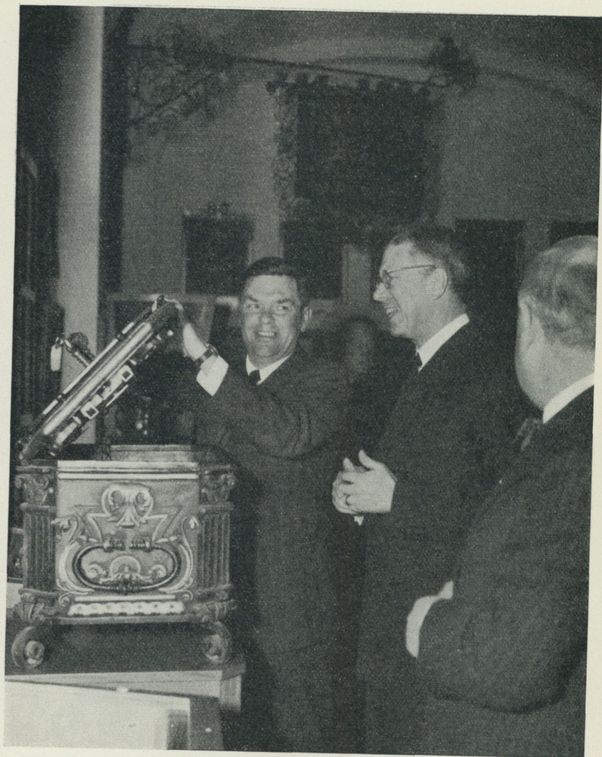
H. M. KONUNG GUSTAF VI ADOLF — museimannen. Vid den nyordnade skråavdelningens öppnande den 22 maj 1951.