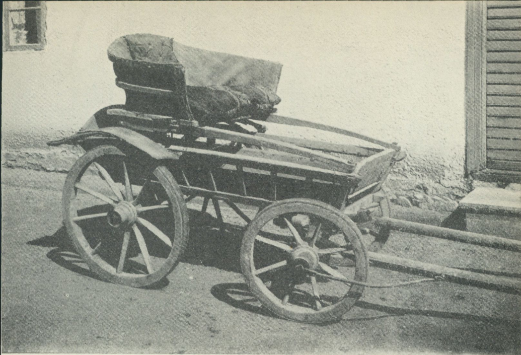
Bild 3. Vagn från Dagstorps socken, Skåne, i vilken enligt traditionen Karl XV skall ha kört från Lund till Västra Karleby.

Gustaff hä va en ritti kung hä. Han sa att hä ä Sveriges krona å Sveriges bönder, söm rår öm landä, så hä va en ritti kung hä.”