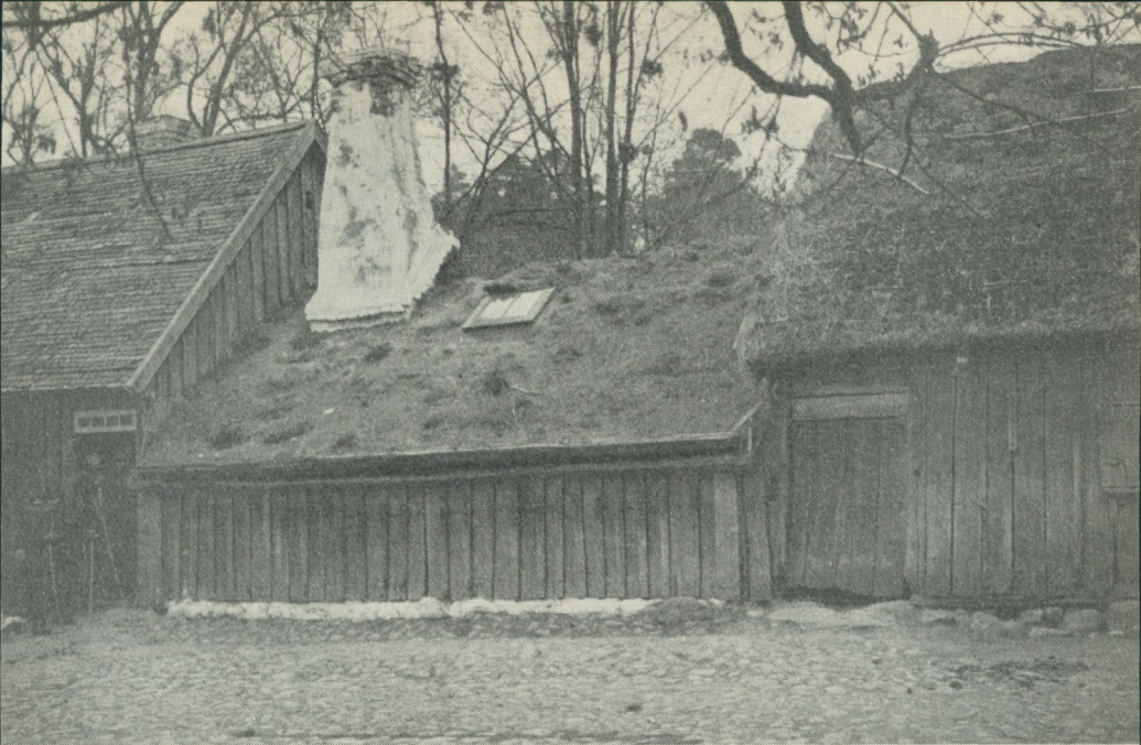
Bild 1. I Karlstorps ryggåsstuga, Övraby socken, Halland, finnes en säng, i vilken enligt traditionen Karl XI tillbringat natten före slaget vid Fyllebro vid Halmstad.

la om. Och att så är fallet, dvs. att knektarna spela en sådan förstaplansroll i dessa sägner, det är ju blott vad man kan vänta. Det var ju de indelta knektarna, som i sin bygd bröto isoleringen och som sin sockens och sin rotes representanter lärde känna andra trakter och andra människor. De lärde sig också en hel del utom "yrket" — som ju för övrigt under 1800-talet var en mycket fredlig krigares yrke. De undervisade ofta på hemorten i läsning, räkning och kristendom; de blevo ej sällan skräddare, och som brukare av sin lilla jordbit berättas det ofta att de införde en sådan nymodighet som potatisodlingen. Men vad de än togo sig för, så hade de ju som sagt sett sig om i världen och mycket hade de hört berättas under mötena på "slätten" eller vid de stora manövrerna, då de sam-