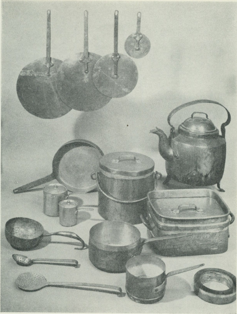
Ett urval av kökskärl från det kungliga lustslottet Tullgarn, vilka Nordiska museet mottagit som gåva. — T. h. bräseringspanna och vattenkokare, t. v. i mitten två värmerikastruller.