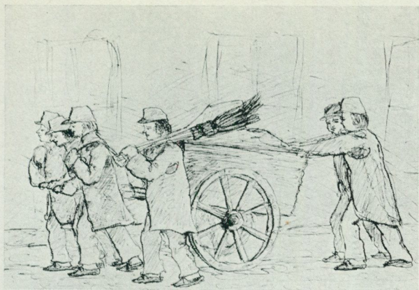
2. Renhållningshjon från Dählströmska arbetsinrättningen. 1858.

med latrinhanteringen började man sända allt större kvantiteter ur staden per järnväg ända till slutet på 1880-talet, när stadens då nyanlagda sopstation vid Lövsta började ta emot också latrinerna för förvandling till pudret, ett gödselmedel bestående av latrin och torvströ. Pudretten och förmultnade sopor av annat slag såldes sedan till jordbrukare och forslades med pråmar till kunderna i Mälardalen och stora delar av Stockholms skärgård. Vid tiden före första världskriget återgick på detta sätt omkring 1 000 pråmlaster årligen till lantbruket som jordförbättringsmedel. Största antalet hämtade latrinkärl var 1907, när nästan 700 000 kärl hämtades på ett år. Därefter sjönk antalet långsamt, allteftersom vattenklosetterna övertog hanteringen. Den första vattenklosetten i Stockholm installerades 1883.