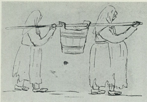
1. Latrinbärning i Stockholm. Teckning i ett brev 1828.

På 1720-talet hade förnyade ansträngningar gjorts att överflytta fastighetsägarnas skyldigheter på en renhållningsentreprenör, men inte förrän 1774 blev denna tanke verklighet. Då anställdes en entreprenör på tio år med skyldighet att hålla gatorna rena och under vintern fria från is samt att bortföra orenlighet från gator och gårdar. Transporten från staden skulle ske med båtar, som lades vid Skeppsbron och Riddarholmen. Efter de tio åren antogs en ny entreprenör, som efter en kort tids verksamhet gick omkull, varefter allt återgick till det gamla med skyldighet för husägarna att själva ombesörja renhållningen.