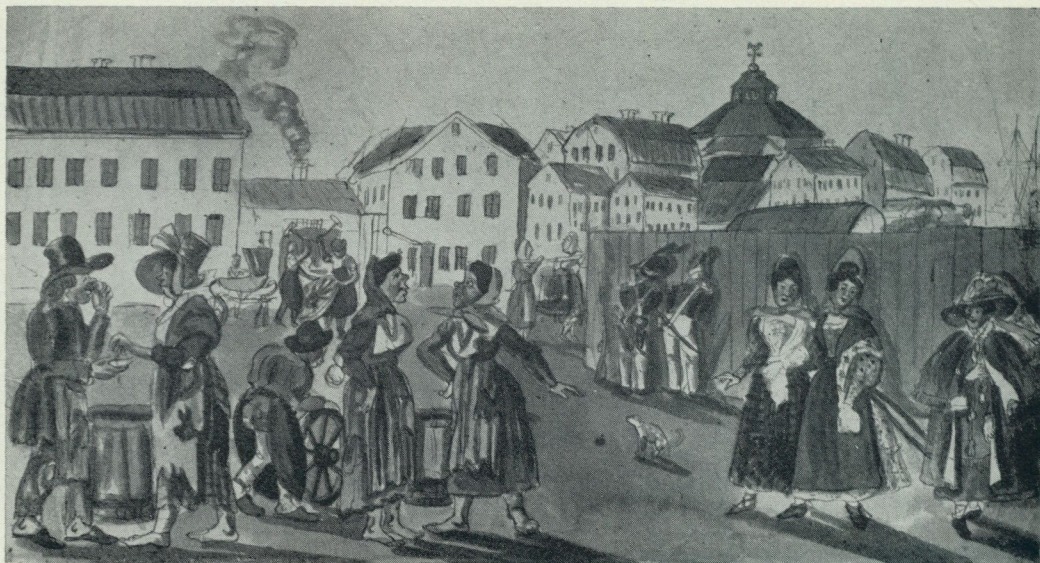
3. Packartorget, nuvarande Norrmalmstorg med ett av Stockholms s. k. flugmöten bakom planket t. h. På bilden synes också några av renhållningshjonen med sina latrintunnor. Akvarell i Uppsala universitetsbibliotek.

köping till de första att ordna ett avloppsnät.