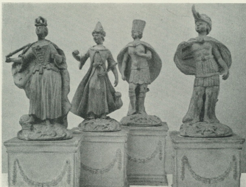
De fyra världsdelarna. Figuriner av terrakotta från Bredsjö porslinsfabrik. Från vänster Europa, Asien, Amerika och Afrika.