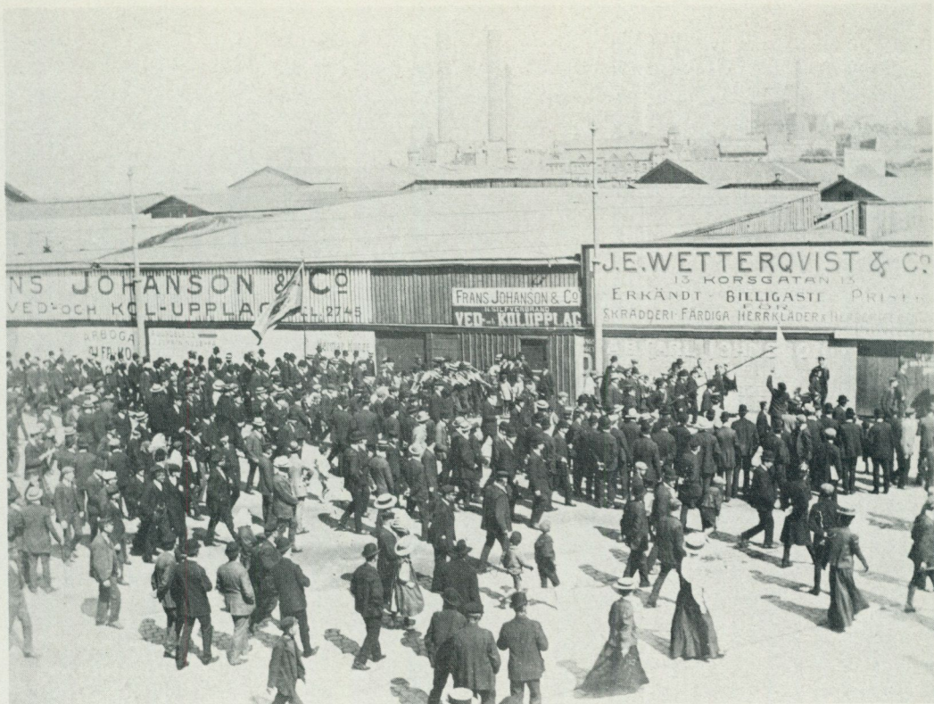
3. Järntorget i Göteborg. Demonstrationer i samband med storstrejken 1909. Foto i Historiska museet i Göteborg.

skulle de svara med en storlockout, vilket innebar att de skulle kasta ut en massa medarbetare som inte hade med striden att göra. LO tillställde Sv. Arbetsgivareföreningen en skrivelse med anmaning att återtaga sitt hot om en storlockout, i annat fall kommer de att proklamera om storstrejk som svar på arbetsgivares stridsåtgärder. Arbetsgivare vidhöll sin inställning och kastade ut textilindustrin, pappersindustrin, massa- och träindustrin m.fl. Detta var i början på juni och LO:s storstrejk kom strax efter med en del andra grupper som kommunikationen, typografer m.fl. Den arbetsplats jag då arbetade på tillhörde textilindustrin,