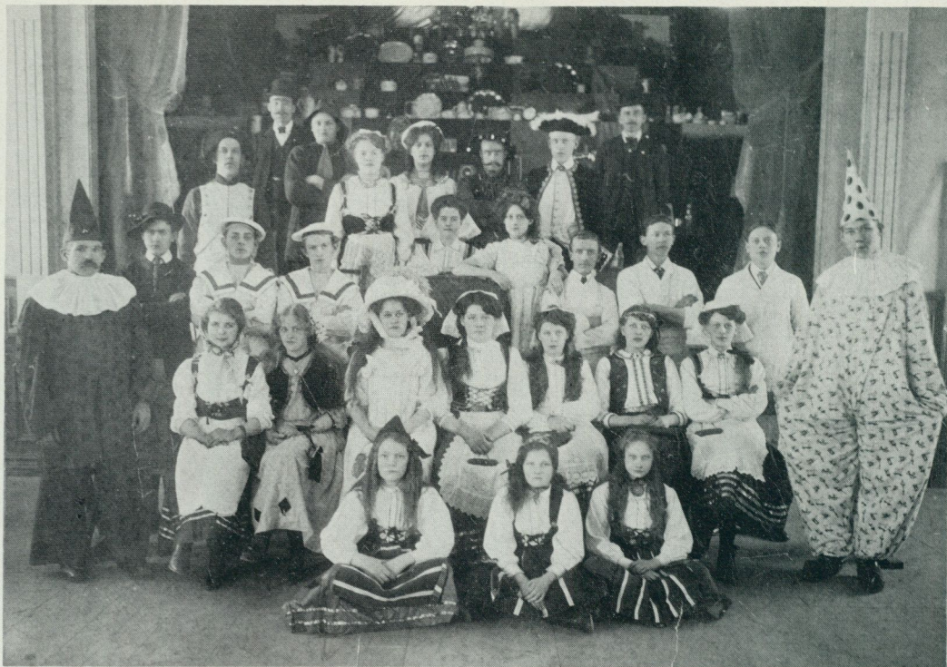
5. Basar i gamla Folkets Hus, anordnad av nykterhetslogen Verdandi, som i stort sett bestod av samma medlemmar som Socialdemokratiska ungdomsklubben. Foto 1910. Folkrörelsearkivet i Mölndal.

besegra. Det var enligt min mening en bland de roligaste perioder som jag varit med om sedan jag kom med i organisationerna. Verdandi avhöll sina möten på tisdagarna och ungdomsklubben på torsdagarna. Lokaler var fulla av medlemmar och man diskuterade alla möjliga frågor som man trodde arbetarklassen kunde behöva taga ställning till. Man sjöng våra kampsånger och aldrig har man hört Internationalen och Arbetets Söner sjungas med en sådan glöd och känsla som det då gjordes.