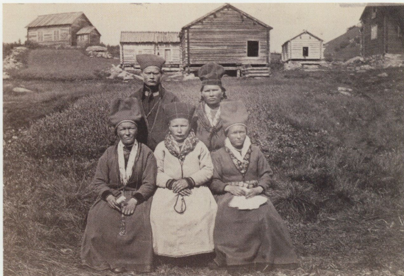
Sorselesamer i Ammarnäs 1871.

var komplicerat, omedelbart före varje fotografering måste negativa prepareras med joderat kolloidum. Exponering och framkallning måste ske medan plåten var våt eftersom negativa bara var ljuskänsliga så länge som emulsionen var fuktig. Mörkrumsarbetet utförde hon i det transportabla mörkrumstältet.