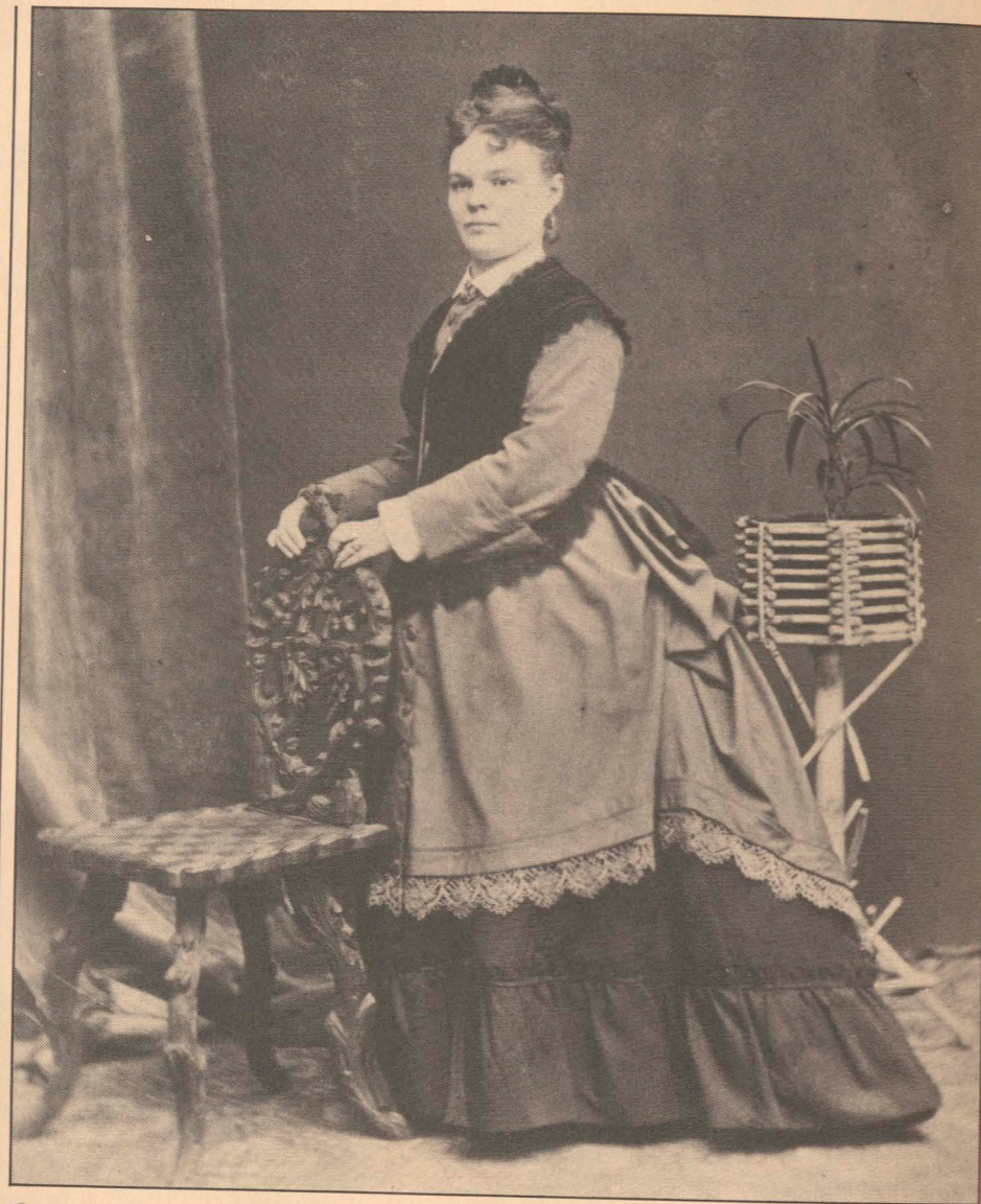
3 Kvinna klädd enligt 1880-talets mode.