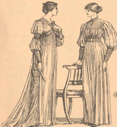
9 Två engelskor i »artistic dress» tecknade av Walter Crane. Aglaia 1894.

Hennes tämligen löst sittande reformklänning med sina Watteau-veck i ryggen hade i Norge framför allt kommit i bruk inom olika konstnärskretsar. Förebilden var hämtad från den »artistic dress» som bars av vissa konstnärliga