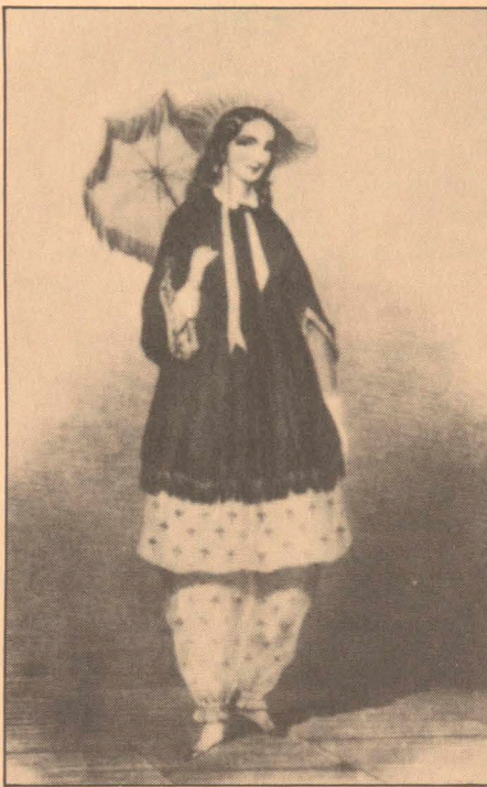
8 Amelia Bloomer, Ohio, USA, ville på 1850-talet införa en byxdress för kvinnor. Stella Mary Newton »Health, Art & Reason». 1974.

cm från marken liksom för olika form på höger respektive vänster sko.