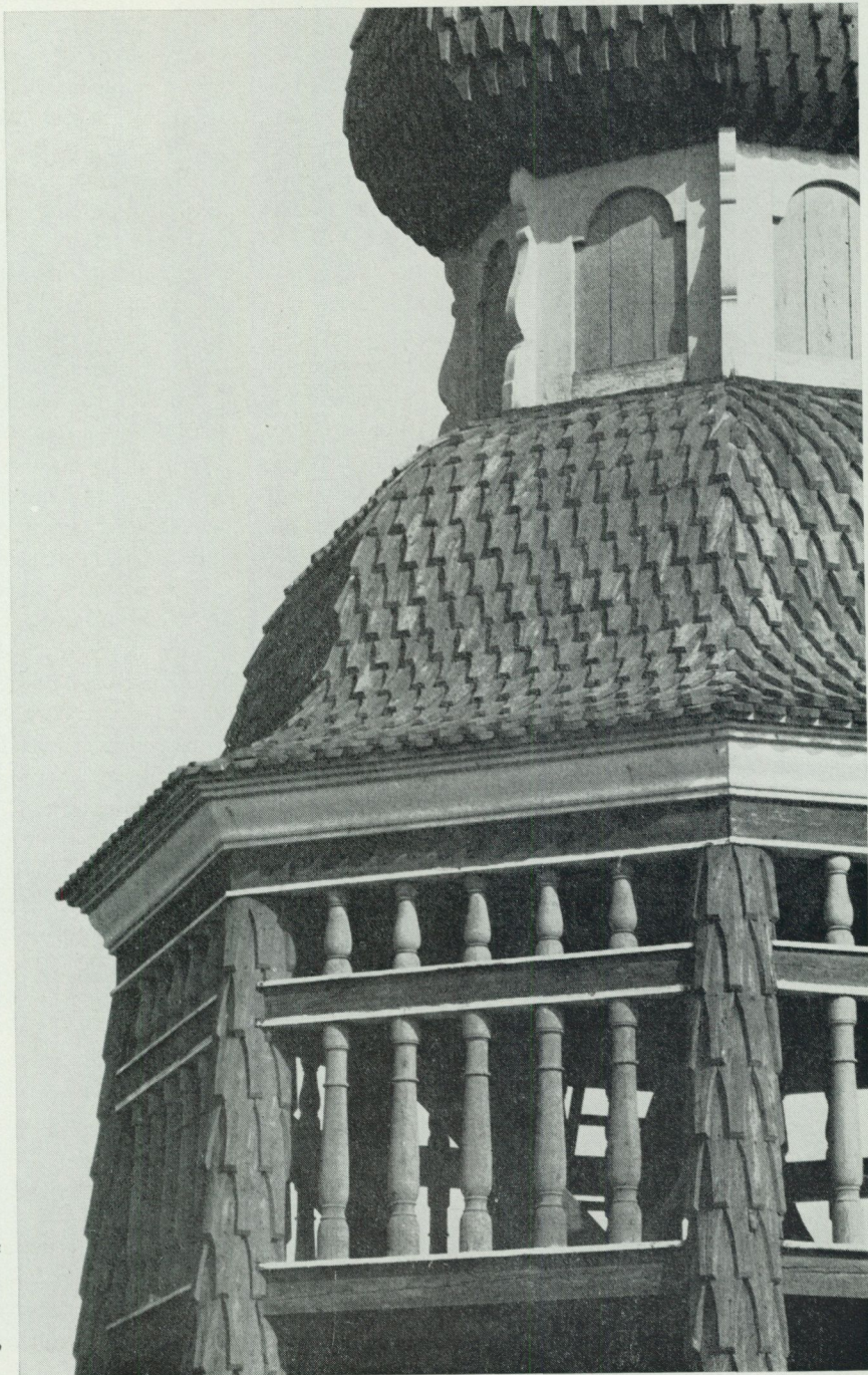
3. Håsjöstapeln på Skansen är klädd med spån. Att täcka en sådan yta kan nästan jämföras med fanéring av en rokokobyrå. Det krävs handlag. Foto 1974.