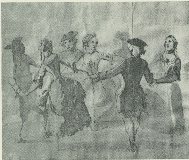
1700-talets kavaljer dansar med hatten på huvudet och tar av den, när han gör sin referens för damen. Tuschlavyr 1764 av Elias Martin, "Deras pichenichers". I privat ägo.