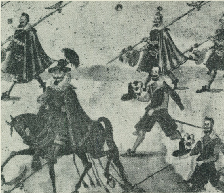
De högtidliga processionerna vid kröningar och begravningar följde ett fast schema. Denna bild är en detalj ur konung Sigismunds bröllopsintåg i Krakau 1605; man ser konungen till häst åtföljd av uppvaaktande ber-rar och hillebardiärer med hattarna i handen. Kungl. Livrustkammaren.

trångboddheten i den tillfälligt överbefolkade staden. ”Här existerar varken gène eller parure”, skriver en av de unga hovher-rarna, friherre von Nolcken till greve Ekeblad, ”man går till hovs alla dagar för- och eftermiddagarna i gråa strumpor och hatten på huvudet, allt som man vill.” 27