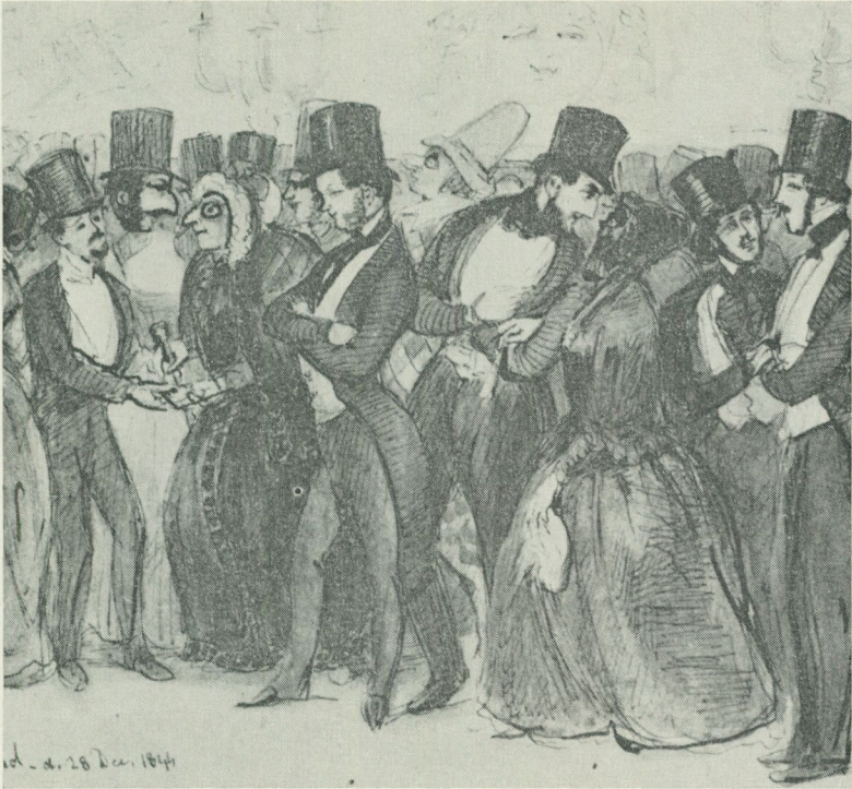
Operamaskeraden den 28 dec. 1844 var talrikt besökt av maskerade damer, de flesta herrarna i frack med den obligatoriska cylinderhatten på huvudet. Färglagd teckning av F. von Dardel. I privat ägo.