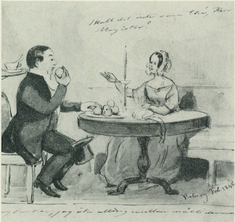
Magistern balanserar artigt på stolskanten och hatten hålls fast mellan knäna. På Koberg 1864. Teckning av F. von Dardel. I privat ägo.

I Bellmans diktning finner man ofta hatten omnämnd. I Fredmans epistlar nr 9 heter det: