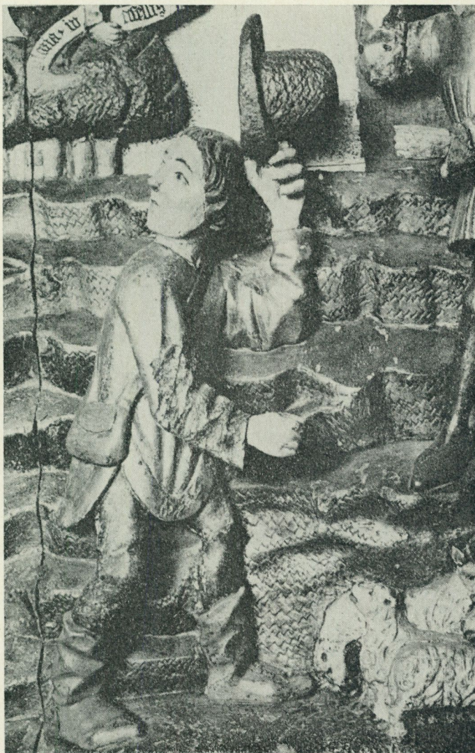
På 1400-talet hälsar en bonde genom att lyfta på hatten. En av herdar- na i altarskåpet från Husby-Långhundra i Uppland. Statens historiska museum.