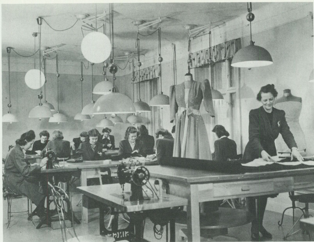
Märthaskolans kortkurs, 1940-talets senare del.