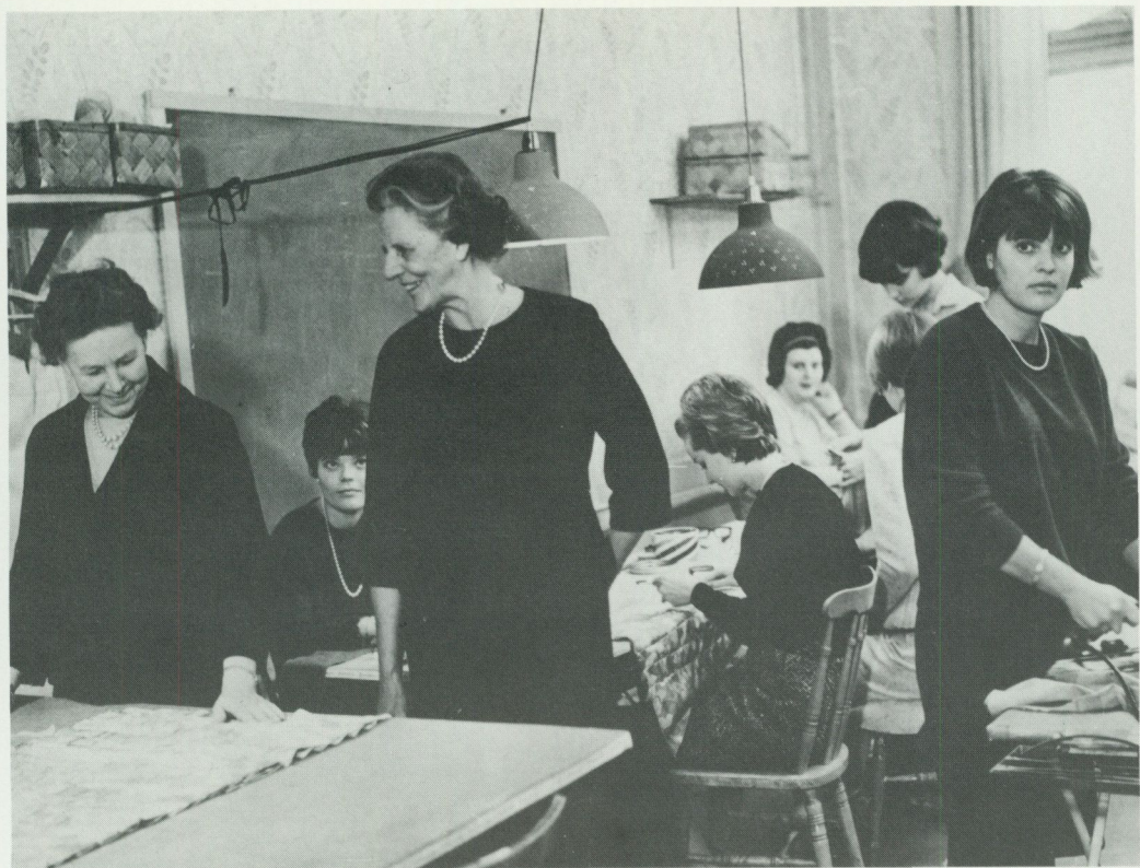
Kortkursen, omkring 1960.

medlemmar gratis sömnadskurs under sommartid.