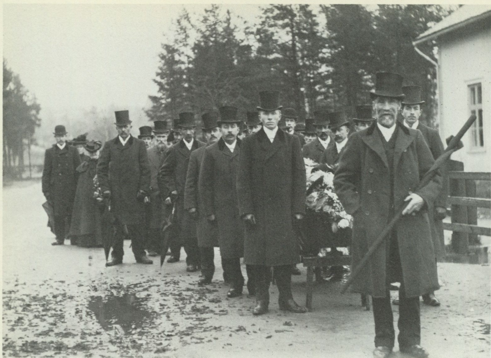
1. Begravningsfölje i Nordmark, Värmland, anförd av en prestav. Ceremonierna kring den döde är övergångsriter. Foto Carl Ohlin omkr. 1912, Nordiska museet.

dessa sista argument kan omedelbart ifrågasättas – menar Gluckman att "inträde (entry) – offer (victim) – utträde (exit)" = "separation – övergång – integration"?