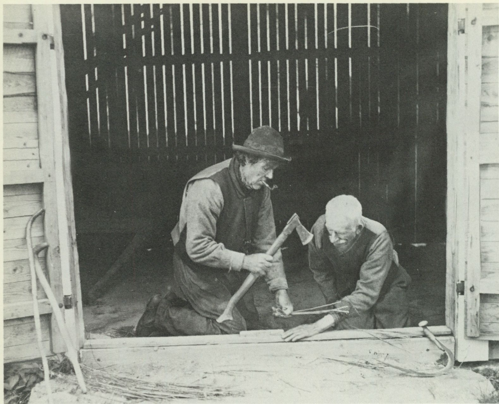
4. "Knarrin hugges bort." Sjukdom innebär en krissituation, och botaren som symboliskt överför smärtorna i handleden till tröskelns trä utför en krisrit. Malax, Österbotten. Foto V. W. Forsblom 1915, Svenska Litteratursällskapets Folkkultursarkiv, Helsingfors.

kan förorsaka en ny botehandling, men det gäller nu en annan sjukdom, ett annat insjuknande. Om botehandlingen förklaras som resultatlös – något som mycket sällan inträffar – t.ex. beroende på ett fel i ritualen, är detta en ny situation, ett annat slags kris som fordrar en annan ritual. Krisriter är dessutom oförutsedda: de överraskar individen eller samhället, och deras uppträdande kan inte på något sätt påverkas. Kanske är det just därför som vissa upplevelser av omen efteråt förknippas med dem – övernaturliga, oförklarliga upplevelser bevaras i minnet, där de sedan dy-