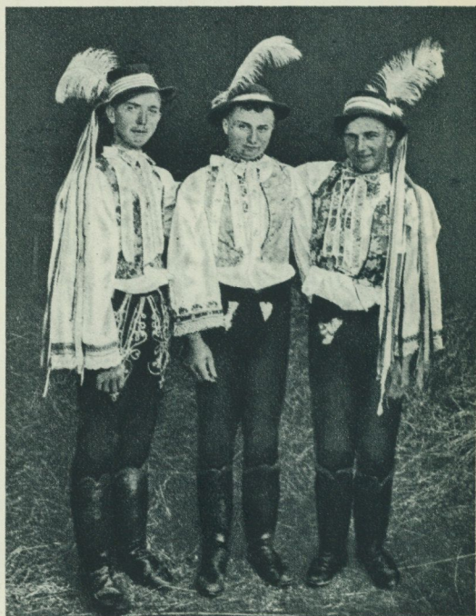
Bild 5. Mönstringspojkar från Hanauerland, Tyskland. Bild 6 och 7. Nyantagna rekryter från Tjeckoslovakien.