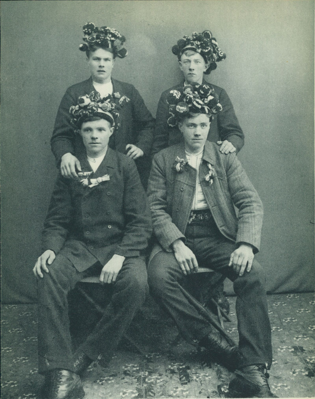
Bild 2. Mönstringspojkar från Siljansnäs. Huvudbonaderna äro prydda med färggranna tofsar och band. Foto 1910.