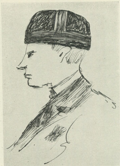
Bild 8. Mönstringspojke med kulörta band kring mössan, 1900-talets början. Teckning efter minnet av Carl Gudmundsson, Leksand.

delen av 1800-talet i Kungsbacka köpte sig blå och gula band, som virades runt hattarna. "Nu går mönstringspojka", sade folk då den så utstyrda skaran drog i väg på morgonen. Från Gästrikland lämnas upplysning om att det varit vanligt att linda gula band om huvudbonaderna. I norra Östergötland pryddes mössorna med röda och vita band, som på huvudbonadernas framsida tvinnades till riktiga rosetter. I Västergötland minnes folk, att det skulle vara flickorna, som prydde pojkarnas hattar med blommor eller fjäder. Fjäder i hatten räknades som förmer än blommor och ansågs nästan som "fästmärke". I Leksand lindades färggranna band runt kullen och över hjässan, så att de liknade galoner på uniformsmössor, bild 8. Från Siljansnäs finnas bevarade några fotografier, utvisande hur mönstringspojkar stått framför ortsfotografens ateljékamera, lika allvarliga och uppstyltade som vid andra högtidliga tillfällen i