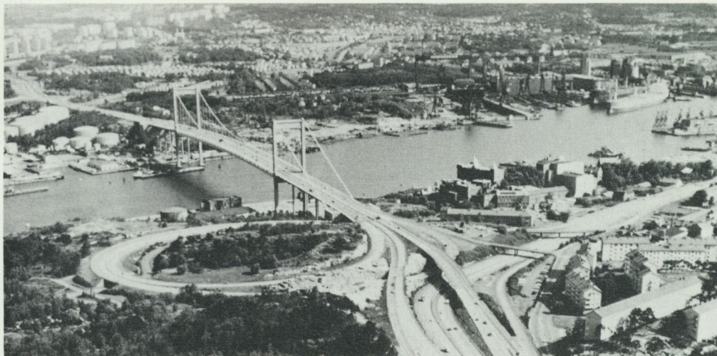
I dalen omedelbart till höger om Älvsborgsbrons landfäste på Hisingssidan låg under 1600-talets första decennium Karl XI:s Göteborg. På höjden strax till höger om brofästet på hitre sidan av älven låg Älvsborgs slott.

I gengäld fick holländarna svenska varor, trä, råg, tjära och inte minst järn och koppar. Speciellt kopparhandeln blev mer eller mindre ett monopol för dessa holländska köpmän. Det hände t.o.m. att kronan fick större förskott av köpmännen än vad Falugruvan kunde producera koppar för.