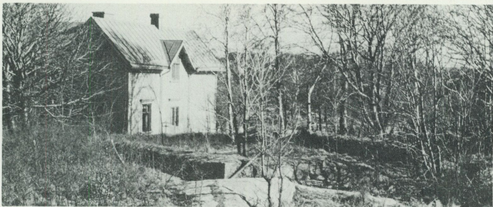
Ruinen av den reformerta kyrkan i Karl IX:s Göteborg omkring 1960.

terligare komplicerad genom att ett kolonialkrig med Portugal samtidigt pågick i Fjärran östern. För de holländare som valde att flytta över till Sverige var det därför en flykt bort från många svårigheter. Det kan i det fallet inte ha varit mycket bättre för lutherska trosbekännare hemma i Holland. De reformerta göteborgarna garderade sig genom kraven om religionsfrihet mot trakasserier av motsvarande slag som hemma i Holland. De lutherska holländarna flyttade till ett land med samma religion som de själva. För båda parter har det varit jämförbart med en flykt till paradiset.