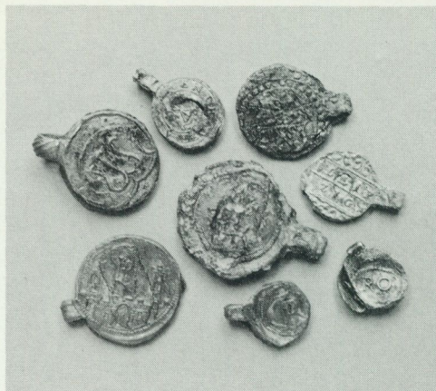
Klädspomber av bly från Holland och Tyskland, funna vid utgrävningar i Nya Lödöse inom stadsdelen Gamlestaden i Göteborg. Göteborgs historiska museum.

När det gäller importen till Nya Lödöse från holländska hamnar är det främst klä-