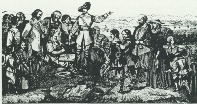
Göteborgs grundläggning genom Gustaf II Adolf år 1618.

1854, samma år som statyn på Gustaf Adolfs Torg avtäcktes, framställdes det här ”kistebrevet”, som synnerligen fantasifullt återger sägner om hur det gick till när Gustav II Adolf grundlade Göteborg. Årtalet 1618 är direkt fel.