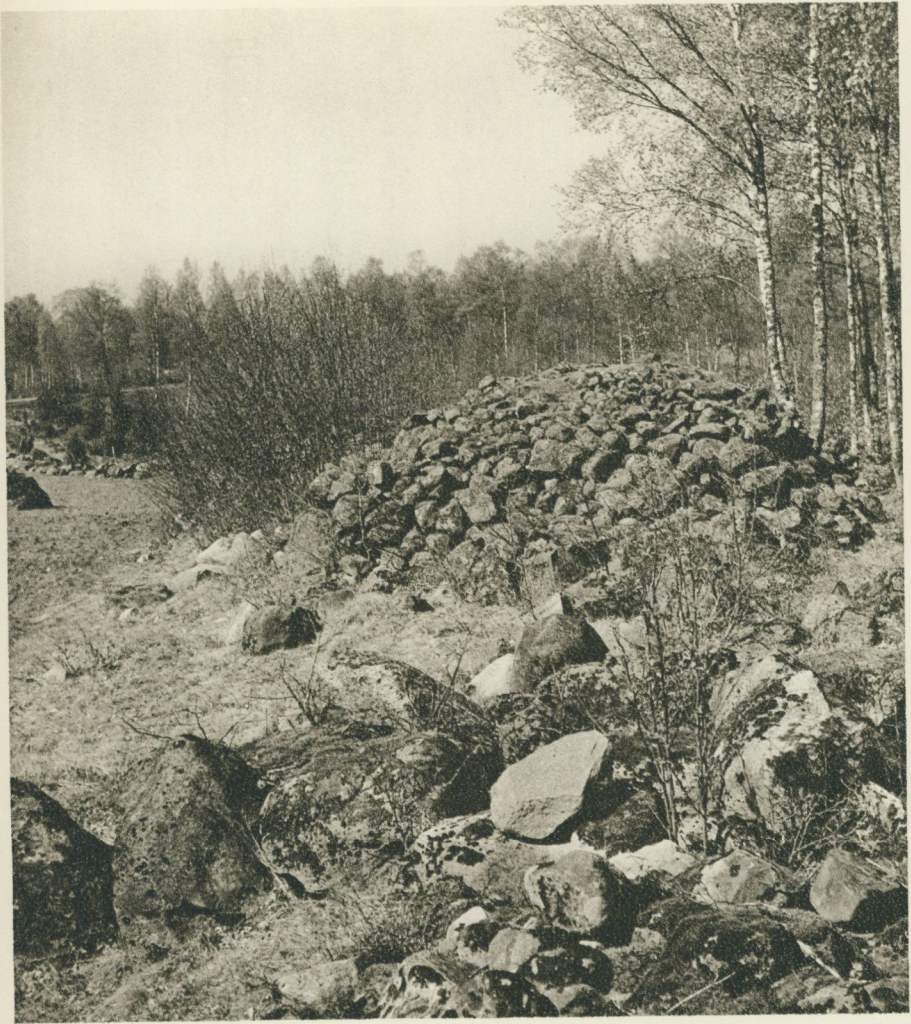
Inägorna kring Tångarne i Stenbrohults socken ger den typiska bilden av odlad moränmark, där de många rösena alltjämt växa i höjden med nybrutna stenar.