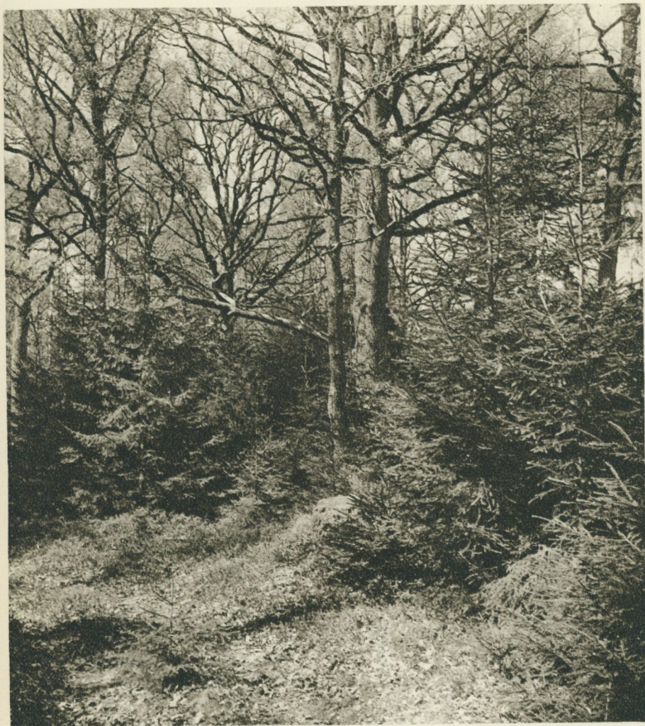
En ständigt återkommande bild i det småländska bondelandskapet av i dag: granskogen vandrar in på den forna ängens mark. Taxås i Stenbrohult.