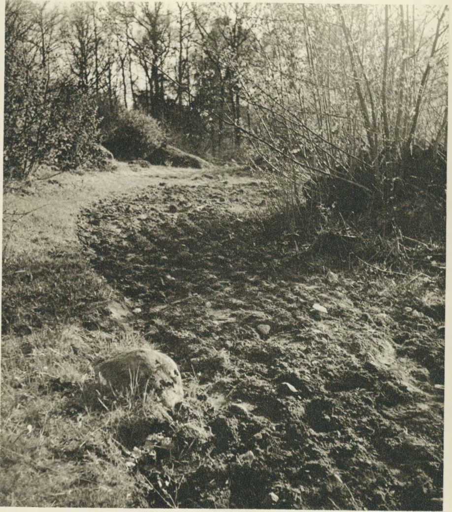
Linnés Råshult ger alltjämt bilden av det gamla gårdet, där åkern liksom trevar sig fram med smala armar mellan flyttblock och odlingsrösen.