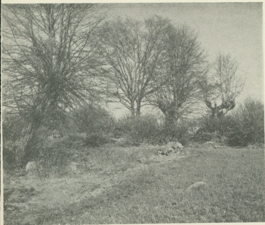
Bild 5. Ett vördnadsvärt minnesmärke över fornsvensk lanthushållning är denna bygdebild med åkern som gläntor i en löväng, präglad av slätter och lövtäkt. I ängen märkes dock en begynnande igenvärning, som snarast borde hejdas. Råshult.