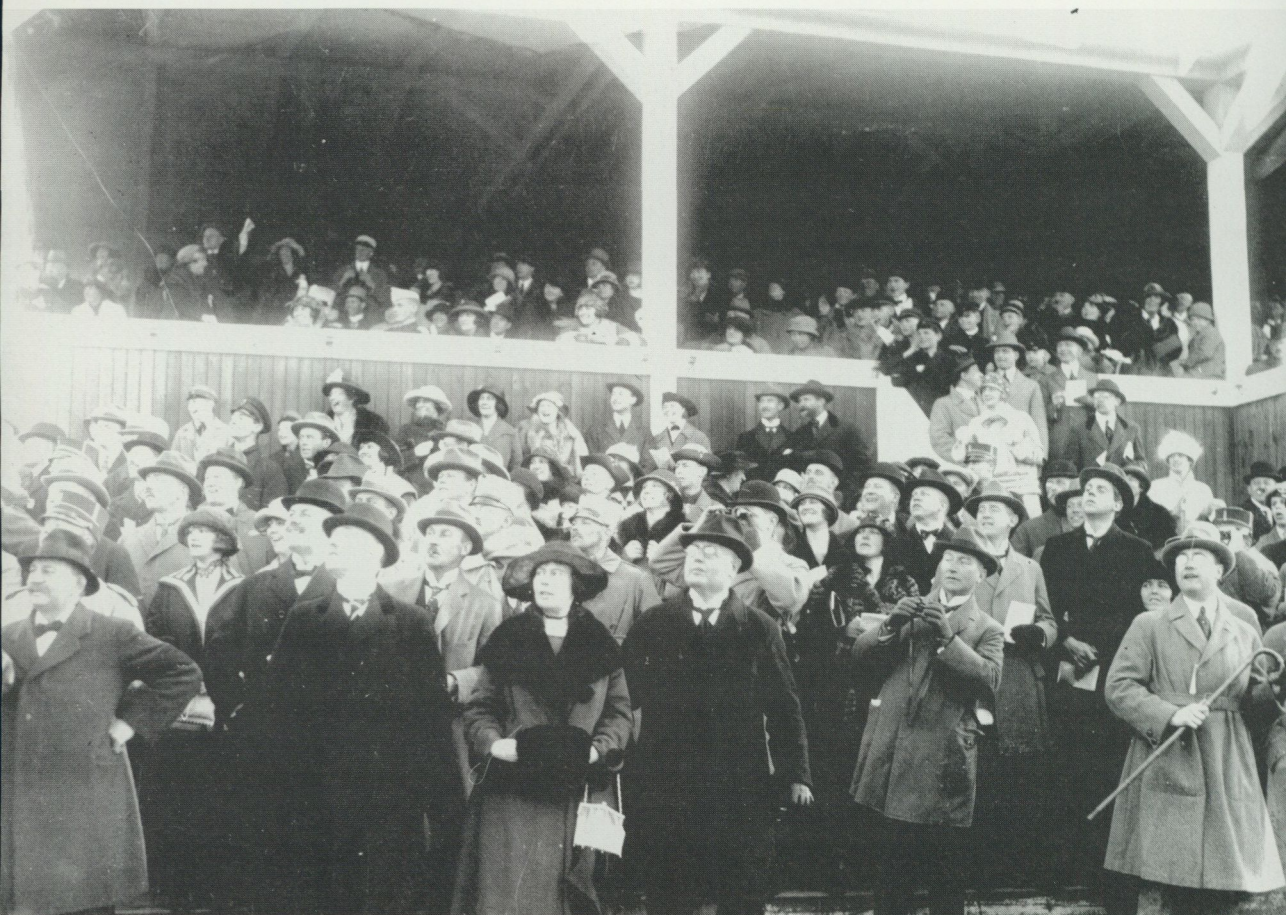
Publik vid hästkapplöpningar på Jägersro i Skåne 1923, det år då totalisatorspel åter blev tillåtet vid svenska kapplöpningsbanor.