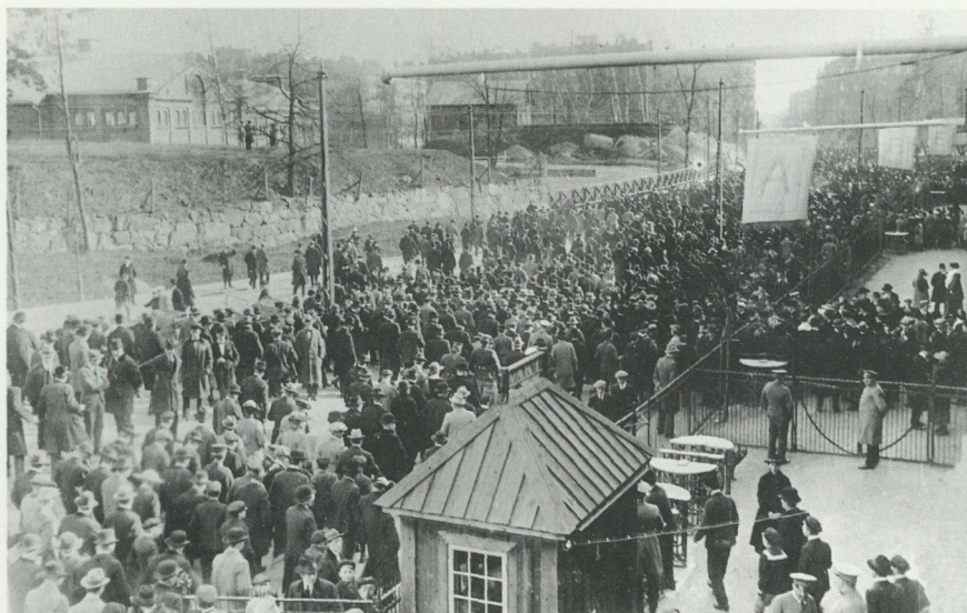
Publikmassor utanför Stockholms stadion.

na präglades av den viktorska tidens gentlemannaideal. Man skulle lära sig att uppskatta det vackra spelet för dess egen skull och att även hylla bortaspelarna för deras insatser, när så var lämpligt. Man skulle iakta och uppskatta »fair play«. Denna moraliska hållning var något nytt i idrottspublikens långa historia och frågan är om den någonsin riktigt internaliserades av den breda publiken. Den framgångsrika disciplinering av teaterns publik, som ägde rum under 1800-talet, hade ingen motsvarighet inom idrottens värld (jfr Hellspång 1983). Inom de flesta idrotter var inte heller det passiva, respektfulla uppträdande som teatercheferna önskade hos sin publik något eftersträvat. Åskådarna till idrottstävlingar fick gärna högljutt ge sin personliga åsikt till känna.