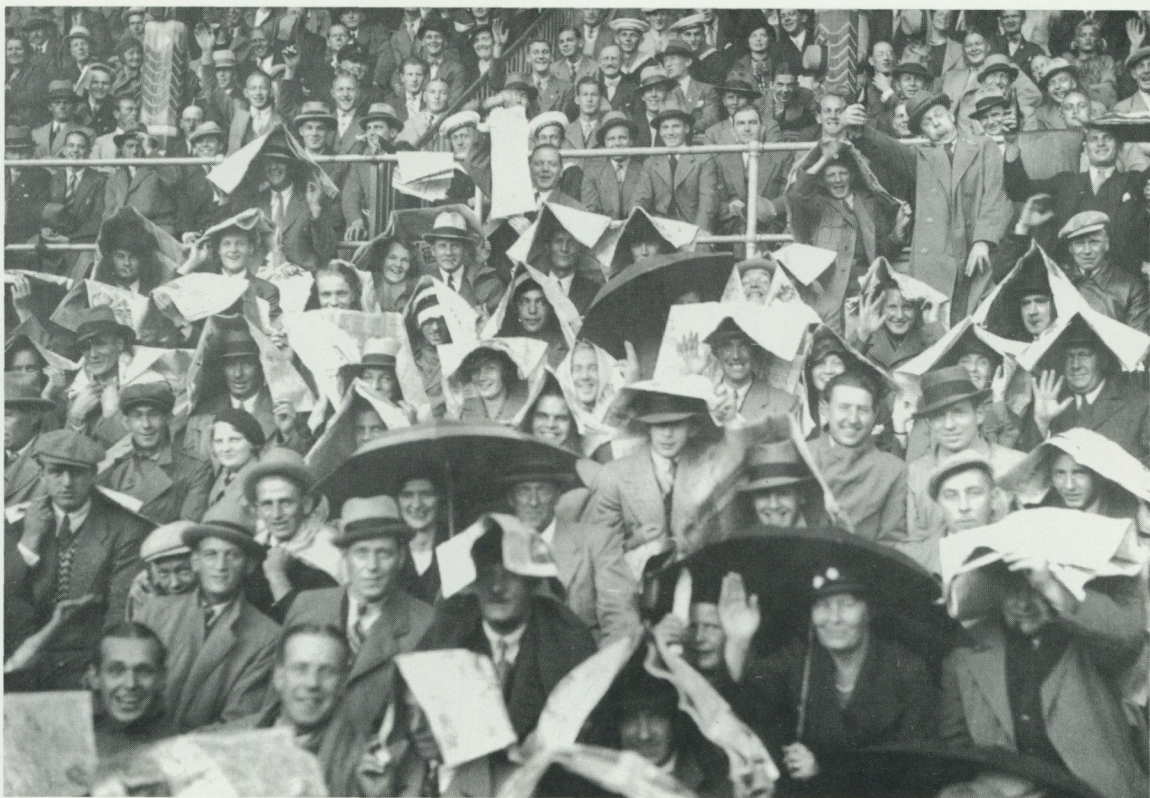
Publik som skyddar sig mot regn med paraplyer och tidningar vid en fotbollslandskamp mot Rumänien i Stockholm 1935.