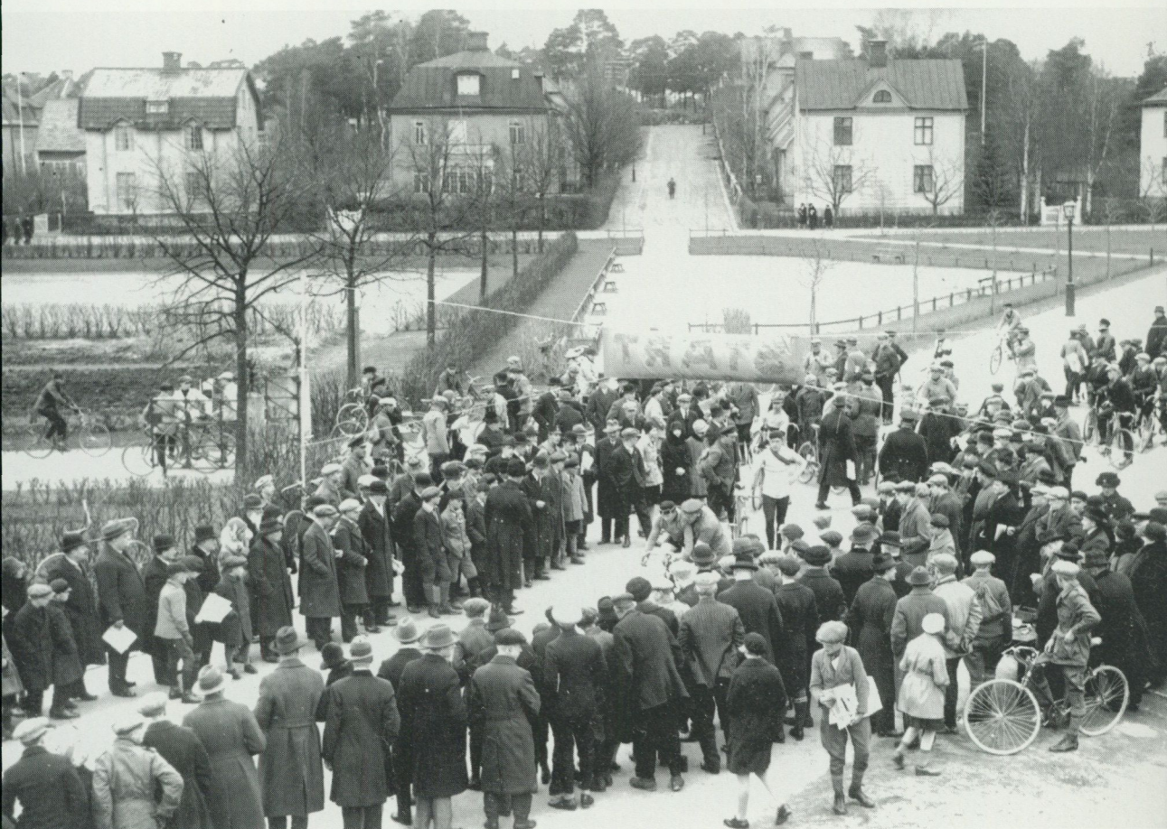
En förortspubliks gratisnöje 1929. Starten i Enskede för Drevviken runt på cykel. Sveriges Centralförenings för idrottens främjande arkiv.