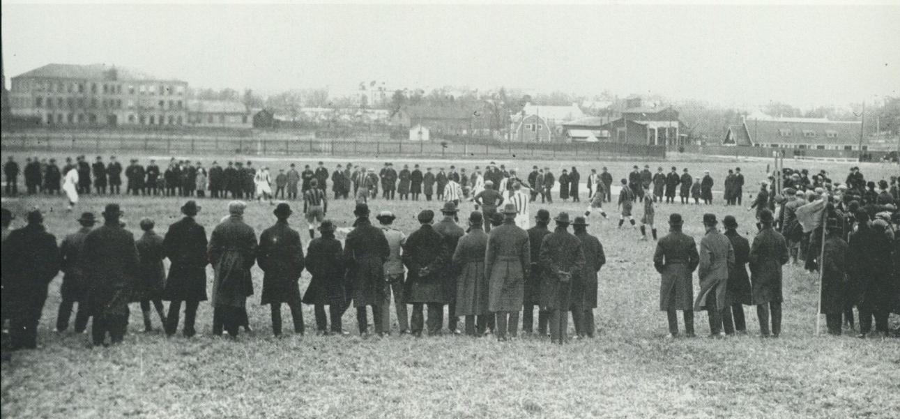
En liten men trofast lokalpublik. Årets första fotbollsmatch på en åker utanför Sundbyberg våren 1926.

Fotbollens historia under seklerna handlar i mycket om ett särskiljande av spelare och åskådare, om ett gradvis införande av regler men också om en begränsning av spelfältet. Det är egentligen först när detta gamla vidlyftiga terrängspel inskränktes till en överblickbar plan med båda målen synliga, som det över huvud taget kunde vara ett nöje att stå som åskådare. Framväxten av en publik gick hand i hand med framväxten av regler som gjorde åskådandet begripligt och intressant, där publiken kunde bedöma spelets finesser och reagera på vad som hände på spelplanen.