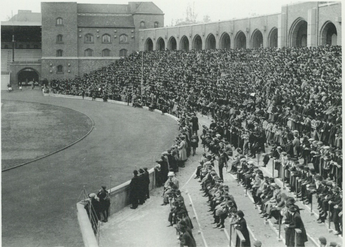
Ståplatspublik på Stockholms stadion 6 maj 1923. Det är gott om plats mellan raderna och ordningen verkar föredömlig. Men just åskådarna på ståplats har alltid utgjort den oroligaste delen av idrottspubliken, särskilt när man packat läktaren full.