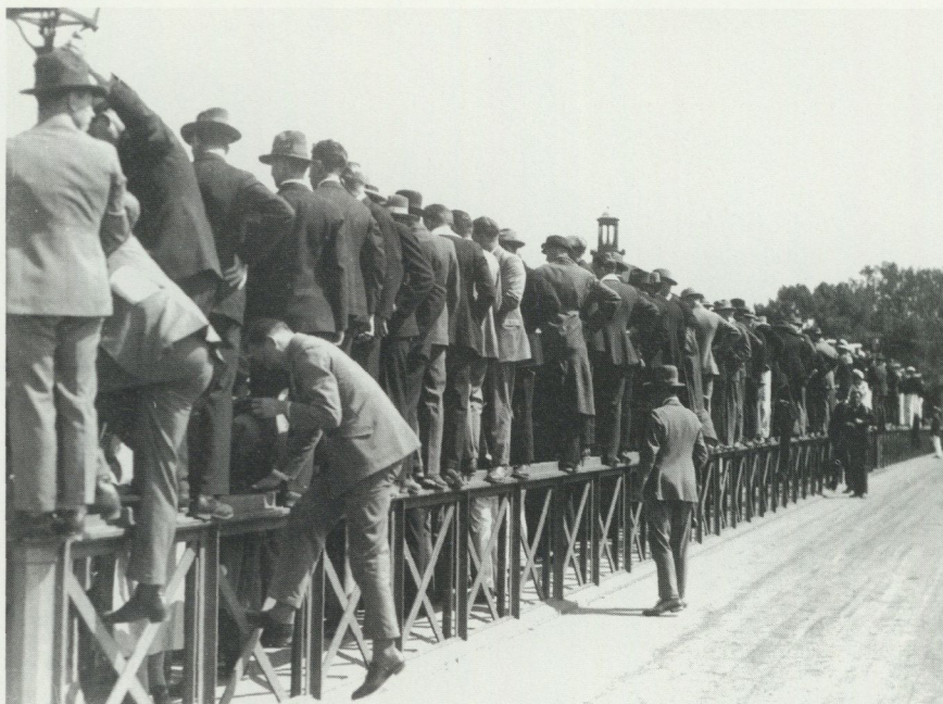
Publik som ställt sig på ett broräcke för att se 1927 års Strömsimning i Stockholms vatten. Femmannalag simmade mellan Stadshuset och Kärleksudden på Djurgården.

tokoll från Villie några mil väster om Ystad, där bönder och drängar 1723 idkat vadhållning rörande kapplöpning och där förlorarna fick bjuda vinnarna på öl (Svensson 1938:65f.). Men man vågar nog påstå att vi också här har en betydande skillnad mellan Sverige och kontinenten. Det var just vadhållningen som lockade publiken till många engelska tävlingar. Det kunde gälla boxning och hästkapplöpning men också löpning till fots, det som engelsmännen kallade pedestrianism. Även kvinnor kunde springa i kapp inför en publik, ibland lätt klädda, varför publikens intresse får förmodas inte enbart ha med vadhållningen att göra (Guttman 1986:64). I England förekom även kvinnlig boxning som en åskådarsport under 1700-talet (Uffenbach 1934:90f.). Till Sverige kom boxningen