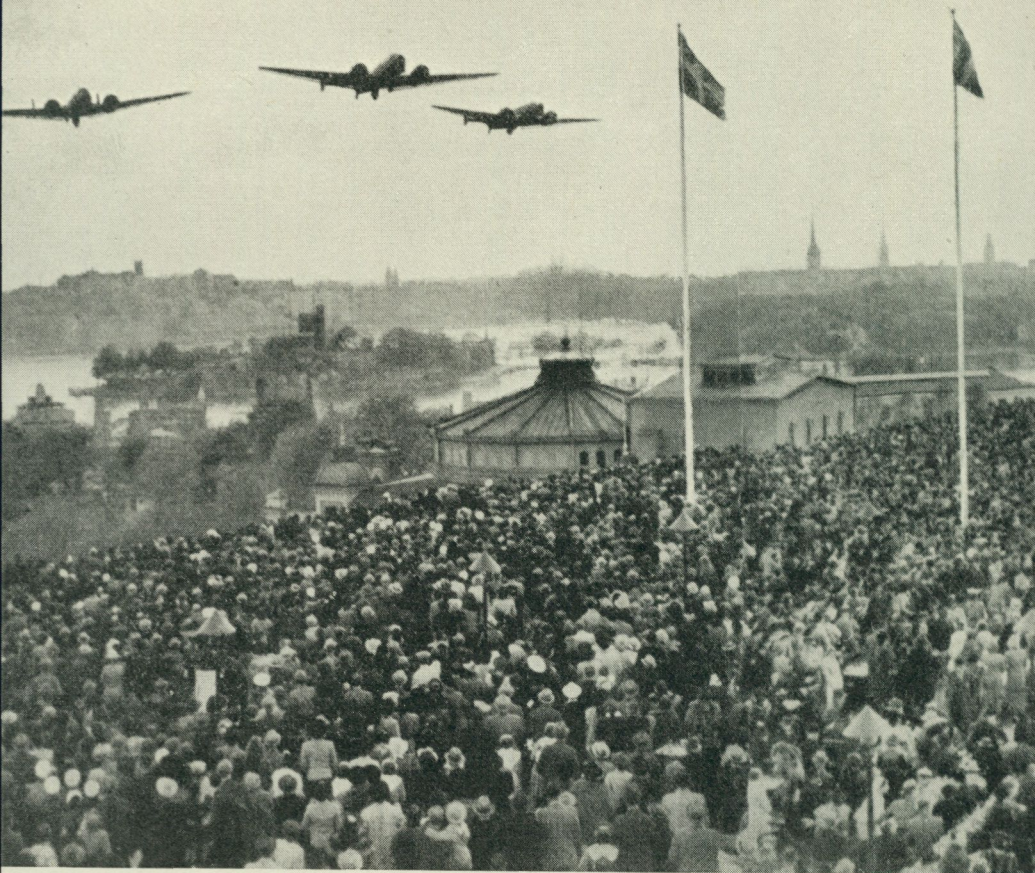
Den stora flyguppvisningen på Skansen vid festen för