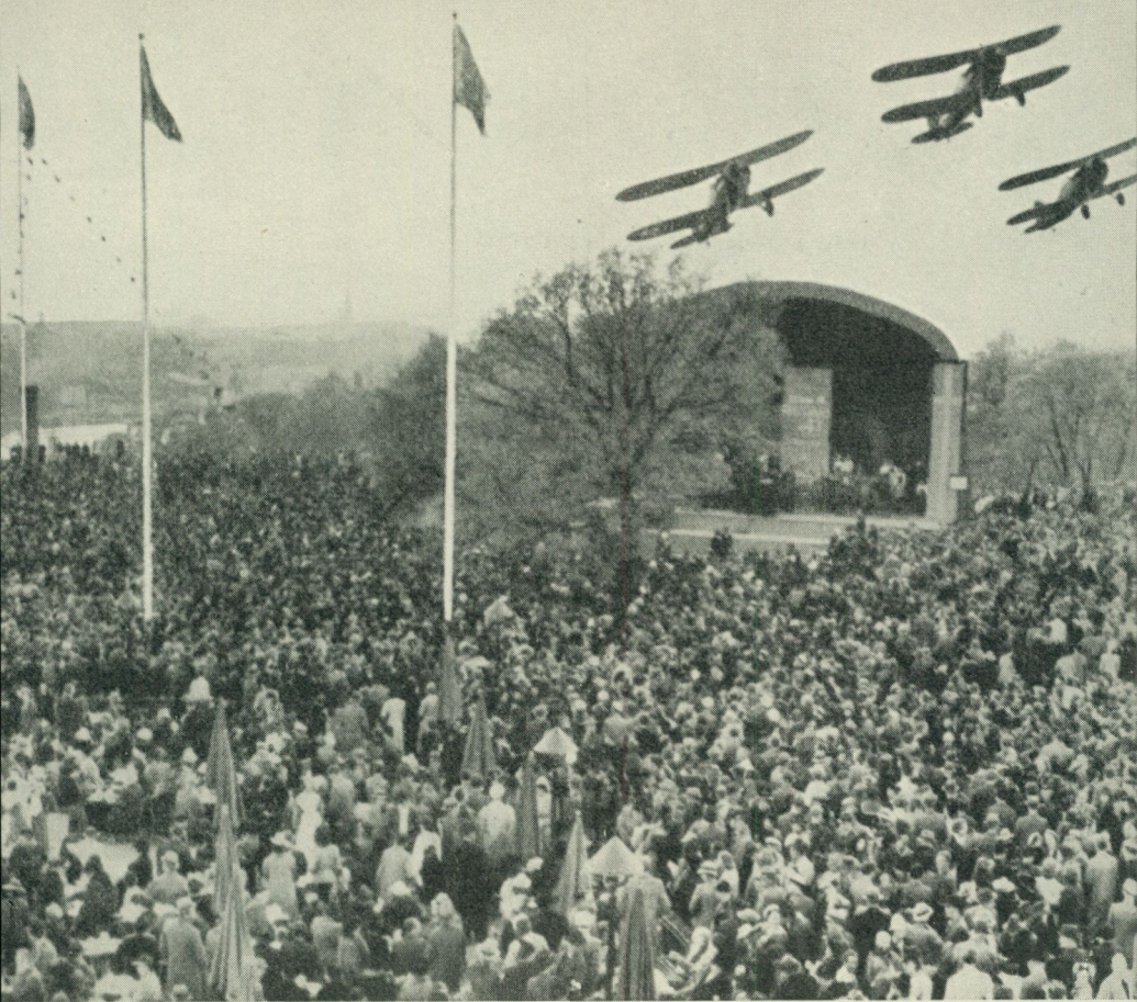
försvarslånet den 25 maj 1940.

kändes dubbelt allvarlig mot bakgrunden av den skrämmande realistiska uppvisning av störtbombare som strax förut ägt rum över åskådarnas huvuden.