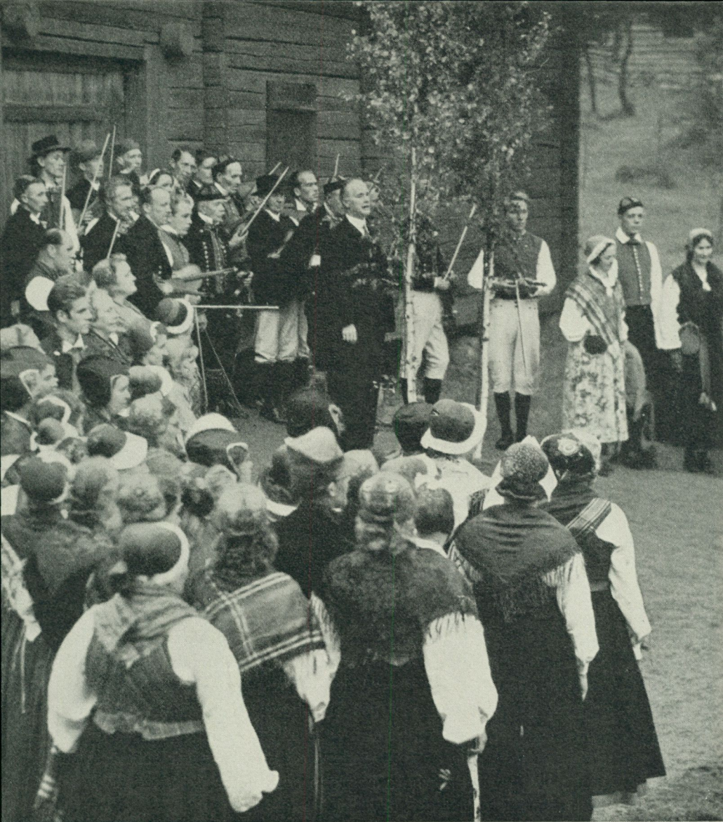
Bygdefolk och spelmän från Hälsingland vid Delsbogårdens invigning.