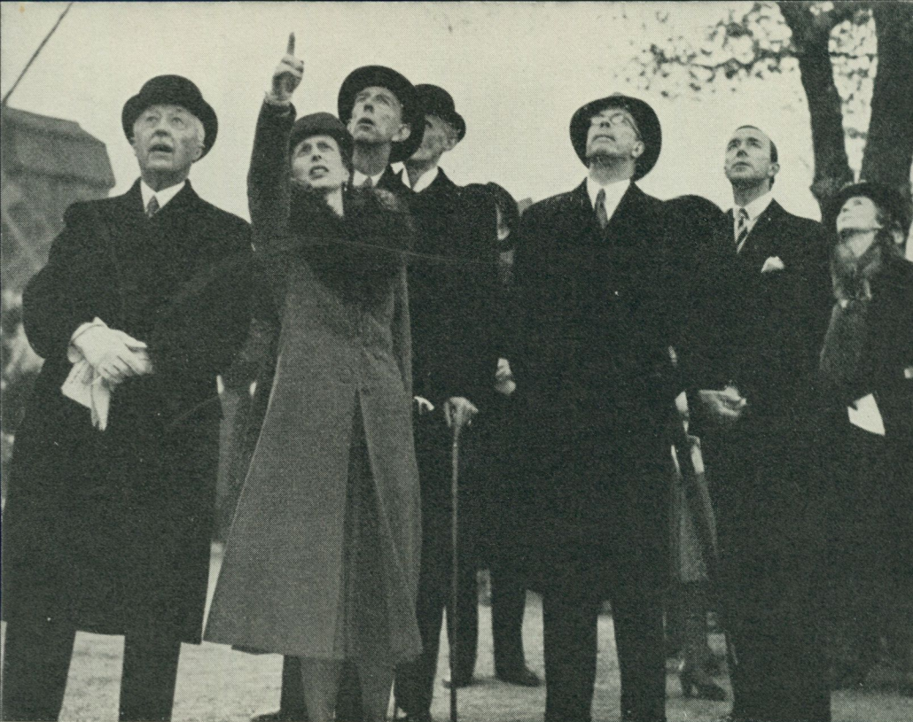
Prins Eugen, Kronprinsessan, Prinsarna Wilhelm och Carl, Kronprinsen och Prins Gustaf Adolf åse flyguppvisningen

dofta och blänka som aldrig annars om året. Innerligare än någonsin känna vi hur djupt allt detta är en del av vårt väsen, att det är detta som ger vårt liv värde och mening. Känslan av att vi måste stå fast samman för att kunna försvara detta vårt mångtusenåriga arv steg som en stum men ofrånkomligt förnimbar bikt i vårkvällen. Man hade verkligen känslan av att det var Ett Folk som här stod samman, ett folk, en tanke, en själ. Det var kvällens gripande behållning." (St.-Tidn.)