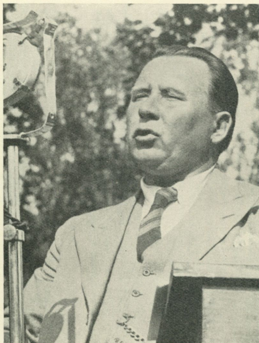
Bild 1. Statsrådet Arthur Engberg talar på Skansen.

Den som med hela sin själ, med varje fiber i sitt väsen är lidelsefullt övertygad om att det stora avgörandet om andelivets frihet sammanfaller med valet mellan de båda motsatta statsordningar, jag här angivit, den torde också förstå, att varhelst två eller tre allvarliga människor äro församlade i våra dagar, där står detta spörsmål mitt ibland dem. Vål är det sant, att upprepning kan verka enformig och tröttande. Det finns dock saker, som icke kunna upprepas ofta nog, sanningar, vilkas oupphörliga inskräpande är en ofrånkomlig plikt. Och när jag så ofta som fallet varit under de senare åren återkommit till dessa tankegångar, så har det berott på min övertygelse, att omistliga värden kunna stå på spel och att intet får underlåtas i arbetet på att väcka och stärka människors känsla av ansvar för den andliga frihet vi fått i arv och ha att försvara och