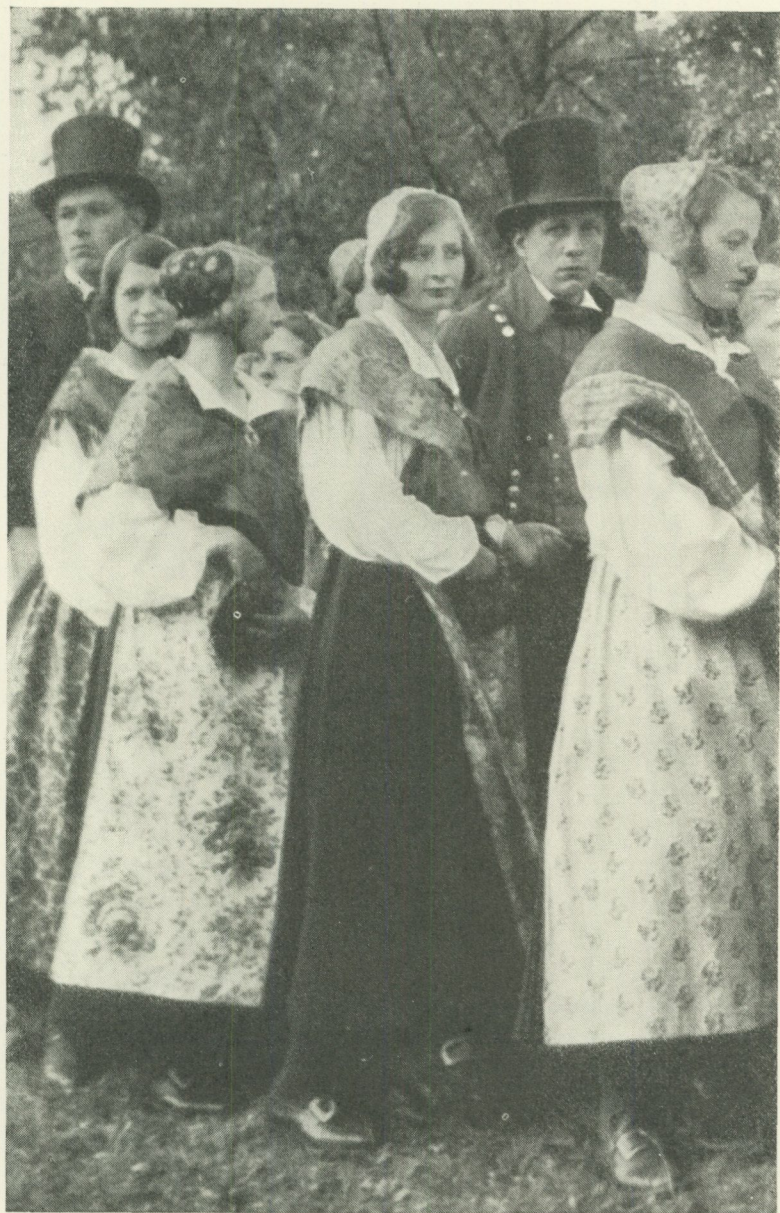
Bild 1. Hälsingeungdom samlad till Hälsingedag på Skansen.