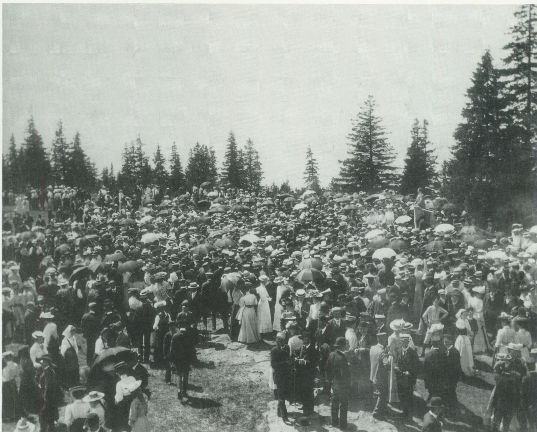
Ungdomsrörelsen samlade stora skaror. Här talar Verner von Heidenstam vid ungdomsmötet på Omberg 1908.