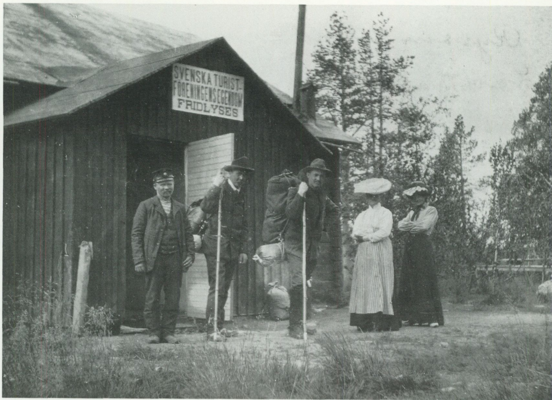
Kalixforsstugan var utgångspunkt för bestigning av Kebnekajse.

den vetenskapliga naturforskningen och en växande kunskap om naturen, grundad på evolutionsläran. Ett uttryck för detta nyvaknade intresse var att Svenska Turistföreningen bildades 1885. Till dess första insatser hörde att organisera turism i fjälltrakterna; I STF:s tidiga årsskrifter berättas om hur man prickat ut stigar, gjort spångningar, rid- och klövjevägar samt byggt övernattningsstationer för fjällvandrare.