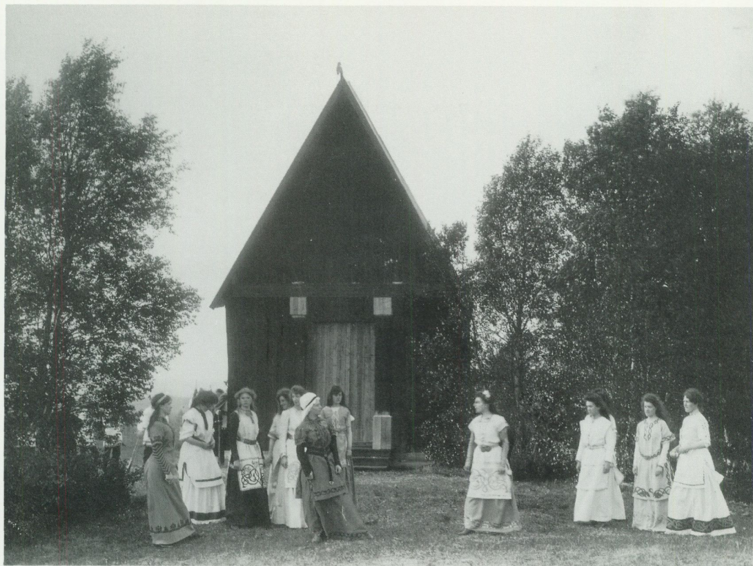
Hembygdsspel är och har länge varit ett medel att stärka banden med det förflutna. Här från Arnljot-spelen på Frösön, som började 1908.

många människors behov av trygghet i en föränderlig verklighet. Känslan för hembygden fyllde detta behov och framtiden tedde sig mindre skrämmande om man kunde ta med sig ett stycke av sitt eget fädernearv, hembygdens natur och kultur, in i framtiden.