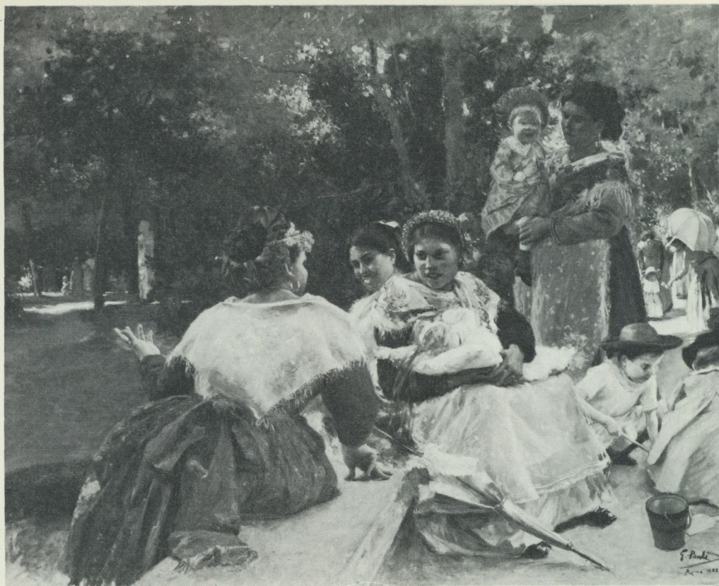
1. Romerska ammor. Oljemålning av Georg Pauli 1888. Göteborgs konstmuseum.

hygienen ledde till att dåtidens hittebarnshospital uppvisade en nästan 100-procentig dödlighet bland de intagna spädbarnen.