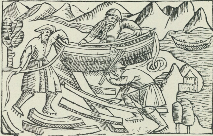
Fig. 4. Båttillverkare efter Olaus Magnus. Historia de gentibus septentrionalibus. Rom 1555.

liknande sådan som användes till sömnad. Författaren omtalar ock bestrykning med tjära, dock tyckes osäkert, om dylik användts äfven af lapparne. Slutligen framhåller han de med vidjor sammanfogade farkosternas stora uthållighet för vågorna på grund af deras elasticitet, samt omtalar, huru han själf under en tjänsteresa år 1518 företagit en högst farlig forsfärd i en dylik båt. 1 En figur söker ock återgifva, huru tillverkningen af de vidjesömmade båtarna tillgick, se fig. 4. Denna bild finnes äfven å Ol. Magnus karta af år 1539.