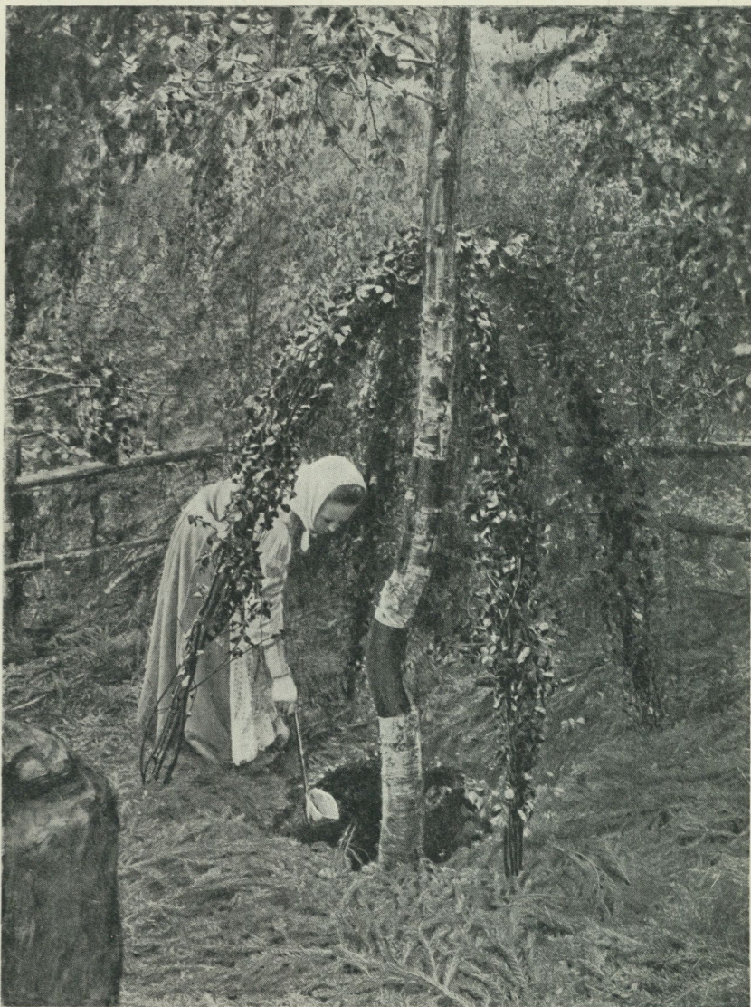
Trefaldighetskälla vid Löfmarken, Söderbärke sn, Dalarna.