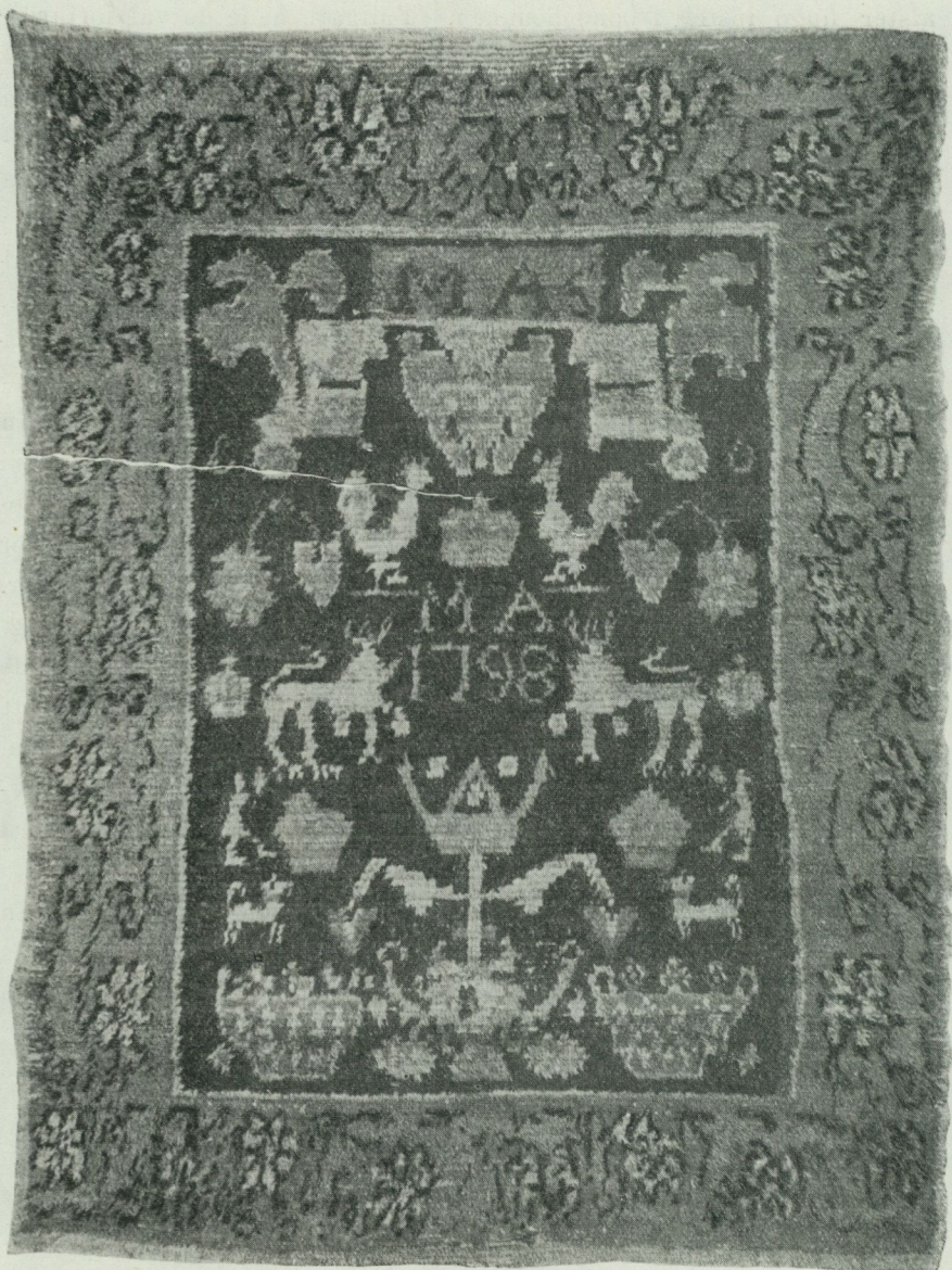
Fig. 2. Rya från år 1798. Wichtis i Nyland.